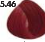
CASTAÑO CLARO COBRIZO ROJIZO Red cooper light brown