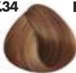
RUBIO DORADO COBRIZO Golden copper blonde