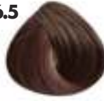
RUBIO OSCURO CAOBA Mahogany dark blonde