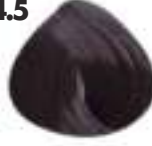
CASTAÑO CAOBA Mahogany brown