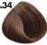
RUBIO OSCURO COBRIZO Golden copper dark blonde