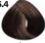
CASTAÑO CLARO COBRIZO Copper light brown