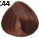
RUBIO COBRIZO PROFUNDO Deep copper blonde