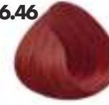
RUBIO OSCURO COBRIZO ROJIZO Cooper red dark blonde