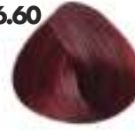
RUBIO OSCURO ROJIZO INTENSO Red dark intense blonde