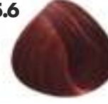
CASTAÑO CLARO ROJIZO Red light brown