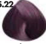
CASTAÑO CLARO VIOLETA INTENSO Indigo violet light brown