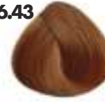
RUBIO OSCURO COBRIZO DORADO Golden copper dark blonde