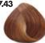
RUBIO COBRIZO DORADO Golden copper blonde