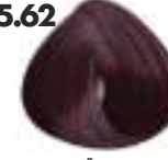
CASTAÑO CLARO ROJIZO VIOLECEO Violet red cooper light brown