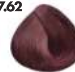
RUBIO ROJIZO VIOLECEO Violet red blonde