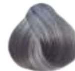
PERLA IRISÉ Irisé pearl grey